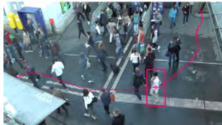
Abbildung 2: Umweg einer Fussgängerin

Ungerichtete Fussgängerflächen wurden in Zürich bei der Pestalozziwiese und beim Bahnhof Stadelhofen beobachtet und gefilmt. Die halbautoma-