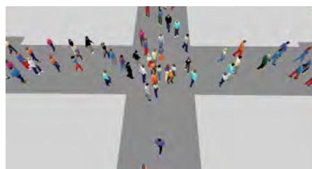
Abbildung 4: Simulation mit PTV Viswalk

atische Auswertung zeigte, dass Zufussgehende grosse Umwege in Kauf nehmen um Flächen hoher Personendichte zu umgehen (Abbildung 2).